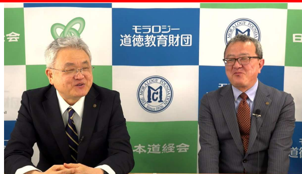
※画像は昨年度のもので